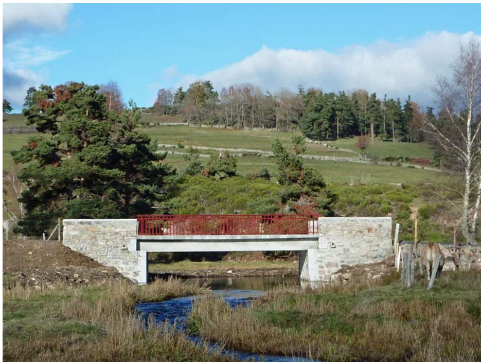
Le pont de las Fédes, n'était autrefois qu'une passerelle en bois qui permettait le passage des brebis au-dessus de la Rimeize.