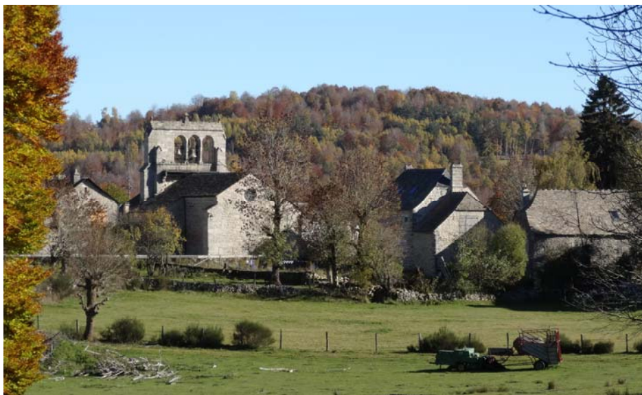
Église du Fau de Peyre